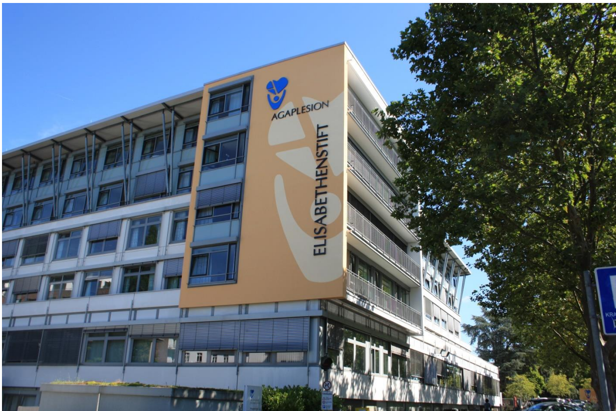
AGAPLESION ELISABETHENSTIFT EVANGELISCHES KRANKENHAUS