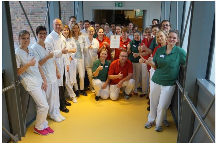
Das multiprofessionelle Team des Zentrums für Palliativmedizin

Das multiprofessionelle Team der Palliativmedizin besteht aus Mitarbeitern verschiedener Professionen wie Medizin, Pflege, Seelsorge, Sozialarbeit, Psychologie, Logopädie, Physiotherapie, Musiktherapie und Kunsttherapie. Darüber hinaus besteht eine enge Zusammenarbeit mit dem ambulanten Hospiz- und Palliativverein Darmstadt.